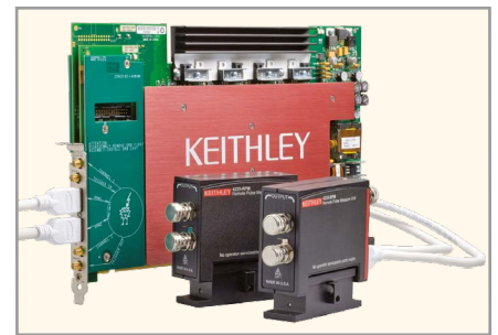
Рис. 2. Параметрический анализатор Keithley 4200-SCS с высокоскоростным модулем измерения вольт-амперных характеристик 4225-PMU

2. Необходимо формирование импульсов с заданной амплитудой, требуемой для записи и стирания содержимо-