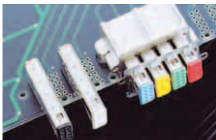
Рис. 2. Монтаж разъёмов в контактные отверстия печатной платы

Большое значение имеют температурные характеристики материалов,