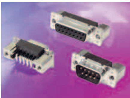
Рис. 1. Разъёмы D-SUB для поверхностного монтажа

Производители электромеханических соединителей предложили дополнить конструкцию корпуса разъёмов