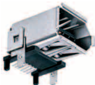
Рис. 3. Пример конструкции корпуса с крепёжными стойками

используемых в процессе производства. Материалы должны выдерживать температурный режим пайки оплавлением без деформации, т.е. не должны коробиться, растрескаться, вздуться и т.п.