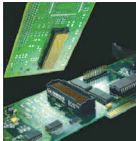
Рис. 5. Пример межплатного соединения