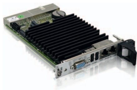
Рис. 1. Плата Kontron CP305 формата CompactPCI 3U, оснащённая процессором Intel Atom N270

Плата CP305 поддерживает температурный диапазон -40 \dots 85^\circ\text{C} , демонстрирует хорошую устойчивость к воздействию ударов и вибрации (соответственно до 30 г и до 5 г) и оптимизирована по цене. Слово «оптимизированный» в дан-