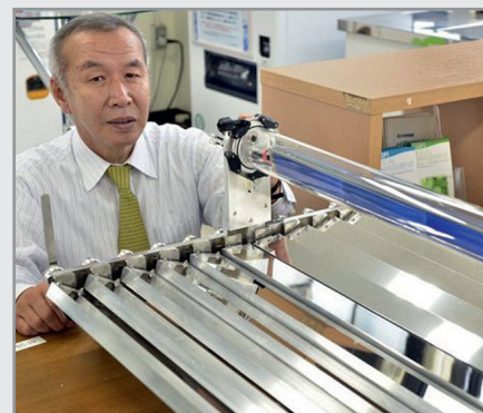
Схема устройства также отличается от традиционного варианта – в разработке Smart Solar International свет попадает не напрямую на фотоэлементы, а на алюминиевые зеркала, отражающие его в сторону закреплённой над ними центральной трубки. А уже в трубке расположены многослойные фотоэлементы. Такой подход позволяет заметно снизить стоимость солнечной панели, поскольку кремний – это основной и наиболее дорогой элемент традиционной плоской солнечной батареи. Конкретная стоимость одной панели не сообщается, судя по всему, окончательно с этим разработчики пока не определились.

Новая солнечная панель защищена от перегрева механизмом перераспределения тепла, направляющим его излишки в водонагревательный контур. Таким образом, Smart Solar International смогла создать устройство «два в одном», обеспечивающее здание электричеством и горячей водой.