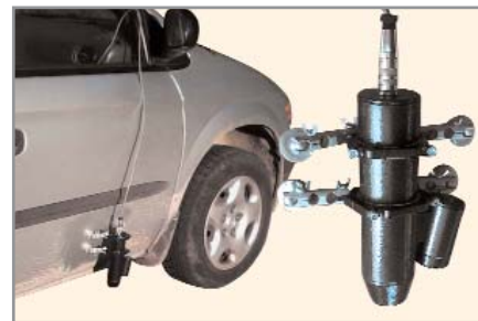
Рис. 2. Применение бесконтактного оптического датчика скорости

Безусловно, реальные физические ограничения (неидеальность оптики, необходимость выделения полезного сигнала на фоне паразитной низкочастотной составляющей, связанной с перепадами общей яркости объекта и т.п.) влияют на диапазон рабочих расстояний, и конечная конструкция датчика получается сложнее. Тем не