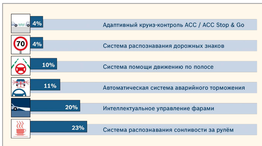
Рис. 1. Присутствие систем помощи водителю в новых автомобилях в Германии в 2013 году по данным Bosch

От знаков ограничения скорости до зон действия знака «обгон запрещён»: 4% новых автомобилей, выпущенных в 2013 году, оснащены системой распознавания дорожных знаков, которая упрощает задачу водителей при ориентировании в многочисленном количестве дорожных указателей. Видеокамера считывает дорожные знаки и выводит соответствующую символическую информацию на приборную панель, как это показано на рисунке 3.