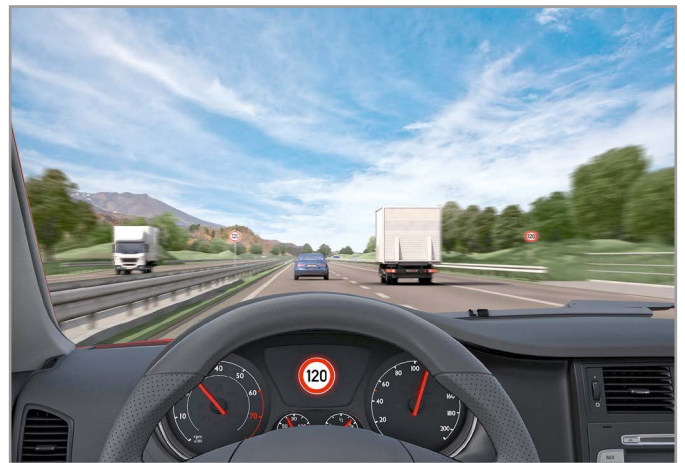
Рис. 3. Своевременная подача информации о действующем на данном участке дорожном знаке