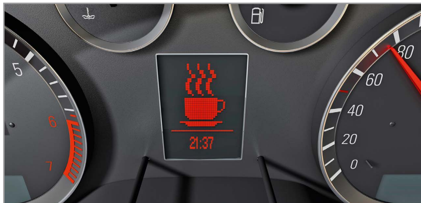
Рис. 7. Распознана усталость водителя – визуальный сигнал дополняется звуковым

Полусонное состояние, снижение концентрации и усталость за рулём чрезвычайно опасны и являются причиной многих несчастных случаев. Первые признаки могут быть обнаружены на ранней стадии: уставшие водители едут менее точно, и им чаще приходится подруливать. С помощью датчика угла поворота рулевого колеса или электроусилителя рулевого управления система обнаружения сонливости от Bosch анализирует поведение человека за рулём с целью выделения закономерностей, характерных для усталости. Система также регистрирует любые резкие движения рулевого колеса. С учётом некоторых других параметров (например, количество времени в пути или текущее время суток), система способна выявить признаки усталости. После этого подаётся звуковой или визуальный сигнал (см. рис. 7), информирующий водителя о необходимости остановиться и сделать перерыв. По