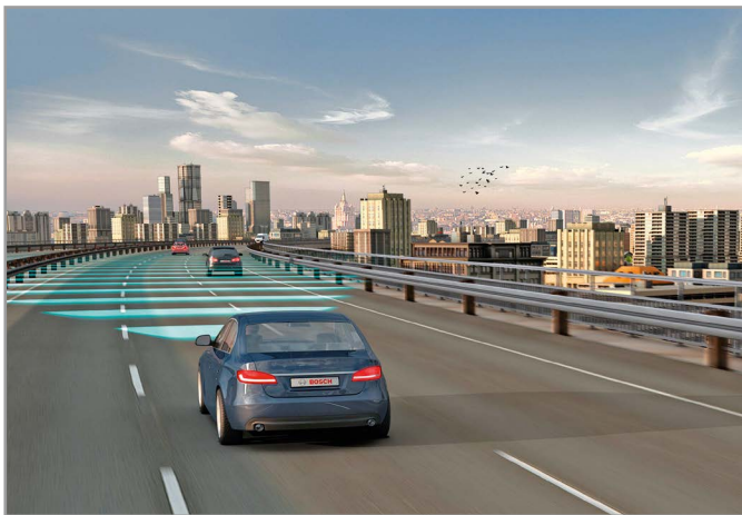
Рис. 2. Сканирование пространства автомобилем, оснащённым адаптивным круиз-контролем