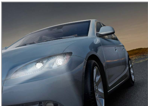
Рис. 6. Интеллектуальное управление пучком света фар в тёмное время суток

жении в ночное время или в туннеле система автоматически включает или выключает фары ближнего света. Если других автомобилей впереди или на полосе встречного движения не обнаружено, происходит автоматическое переключение на дальний свет (при условии, что транспортное средство находится не в населённом пункте). Кроме того, система интеллектуального управления фарами способна изменять направление светового пучка в сторону поворота и плавно регулировать свет от ближнего к дальнему (см. рис. 6). В результате система обеспечивает наилучшее освещение без ослепления других участников дорожного движения. По данным на 2013 год, такие системы уже установлены на 20% новых автомобилей.