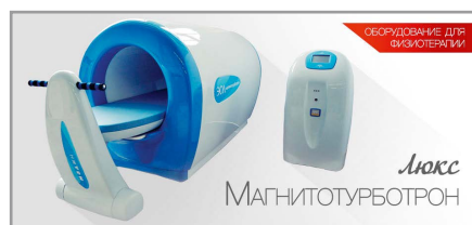
Рис. 7. Рекламная листовка «Магнитотурботрон Люкс»

Установка «Магнитотурботрон Стандарт» по своему техническому уровню соответствует УВМП-2,5/100 «Авангард» и отличается современным дизайном и удобным интерфейсом управления в виде сенсорного дисплея. Аппарат соответствует современным требованиям практического здравоохранения, обеспечивая защиту от неправильного включения и перепадов напряжения в электросети, широкие возможности выбора частотных характеристик магнитного поля, законов модуляции, продолжительности цикла и процедуры, направления вращения поля. Надёжность и стабильность работы установки повышена за счёт перехода на современную элементную базу.