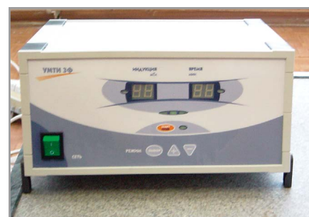
Рис. 3. Блок управления установкой УМТИ-3Ф

гом установки УМТИ-3Ф и отличается от неё только интерфейсом управления (см. рис. 5).