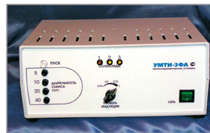
Рис. 5. Лицевая панель блока управления установкой УМТИ-3ФА

Ассортимент магнитотерапевтической аппаратуры выпускает и ООО НПЦ «ММЦ «Мадин» (г. Нижний Новгород). Это магнитотерапевтические установ-