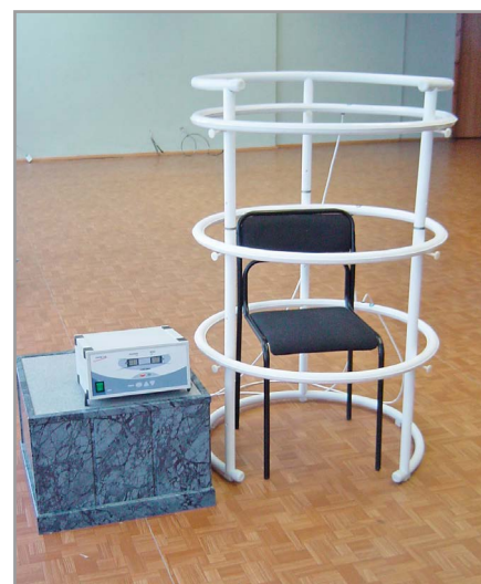
Рис. 2. Внешний вид установки УМТИ-3Ф

ООО «Мидас» (г. Саров) является разработчиком и производителем магнитотерапевтической установки УМТИ-3ФА, которая по техническим характеристикам и функциональным возможностям является полным анало-