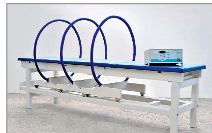
Рис. 6. Внешний вид установки «Колибри-Эксперт» вместе со специализированной кушеткой для пациента

ки УМТИ-3Ф в исполнениях «Колибри» и «Колибри-Эксперт», «Магнитотурботрон Люкс» (УМТвп – «Мадин») и «Магнитотурботрон Стандарт». Внешний вид «Колибри-Эксперт» вместе со специализированной кушеткой для пациента представлен на рисунке 6. Основные технические характеристики установок «Колибри» и «Колибри-Эксперт» приведены в таблице 3.