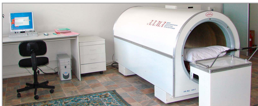
Рис. 8. Аппарат «Алма» в кабинете физиотерапевта

Следует отметить, что у нас стране продолжают исследования влияния переменного магнитного поля на биологические структуры как на фундаментальном, так и на прикладном уровне (РФЯЦ-ВНИИЭФ, г. Саров). Наверное,